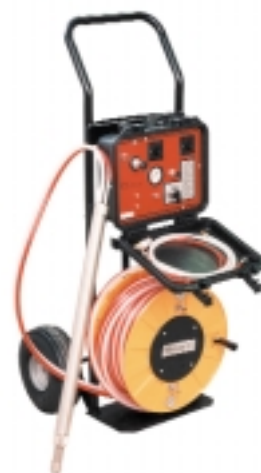
Sistema Portátil con Bomba Modelo 407 (ó 408), con Controlador Neumático Modelo 465 (abajo).