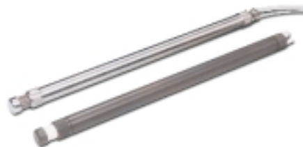
Dos Bombas de Doble Válvula Modelo 408: en AISI 316 y en PVC. Operan hasta 600 m. de profundidad.

SOLINST, Canadá, Modelo 408, desde $ 396*