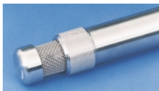
Extremo de la bomba Modelo 407 con filtrante fácilmente reemplazable.